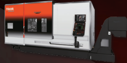
Multi-Tasking-Maschine INTEGREX i-450H S