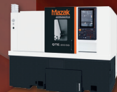
Drehzentrum QTE-300 MSY SG SmoothEZ