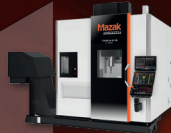
5-Achsen-Bearbeitungszentrum VARIAXIS C-600